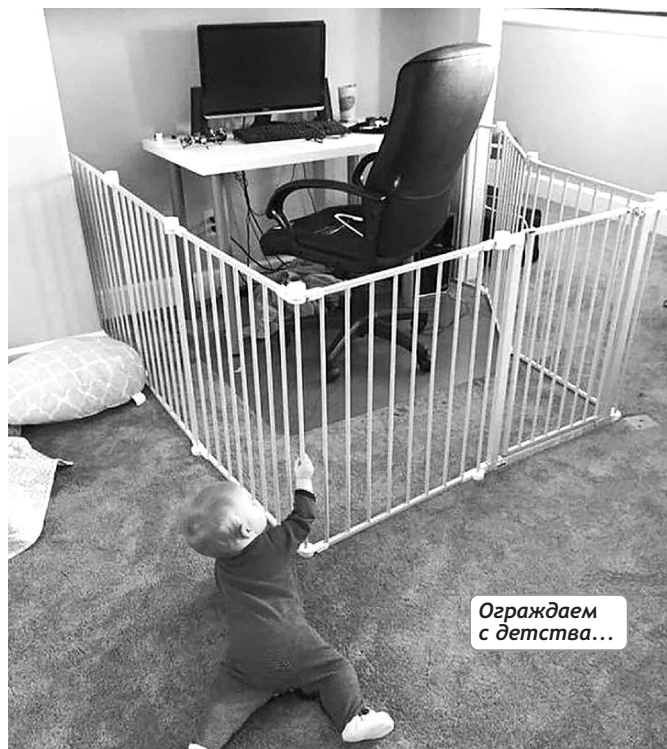
Ограждаем с детства...

В Госдуме вычислили шпиона: это был единственный депутат,