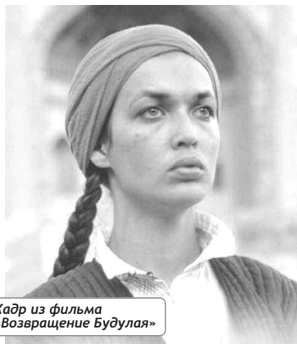
Кадр из фильма «Возвращение Будулая»

Так случилось, что Алимова оказалась под оккультным воздействием одного экстрасенса, которые в 1990-е стали набирать популярность. «Избегайте контактов с экстрасенсами, не поддавайтесь на предложения “полечить”, “зарядить энергией” и тому подобное, это может очень плохо закончиться, — делится актриса. — Мне же тогда повезло, Господь меня ►►