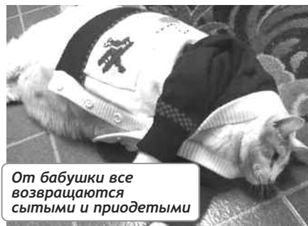
От бабушки все возвращаются сытыми и приодетыми

Сегодня были в цирке. Выступал йог. Прошел по горячим углям. Кричал так, что зрители чуть не оглохли. Наверное, стажер.