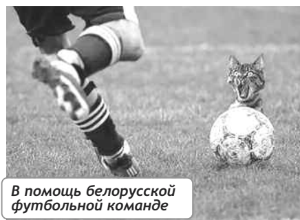
В помощь белорусской футбольной команде

Если в лесу вы встретили медведя, клещей уже можно не бояться.