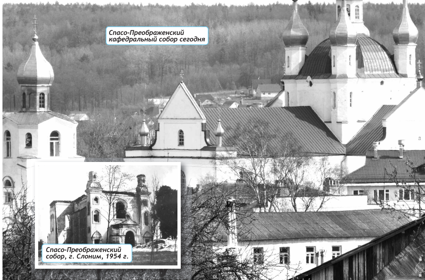
Спасо-Преображенский кафедральный собор сегодня