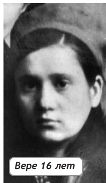
Вере 16 лет

и после. А еще она никогда ни с кем не ссорилась, никого не обижала и не обижалась сама, потому что с детства очень боялась обидеть этим Бога, на Которого всегда уповала. Никогда она не роптала, не жаловалась, как часто принято, на судьбу.